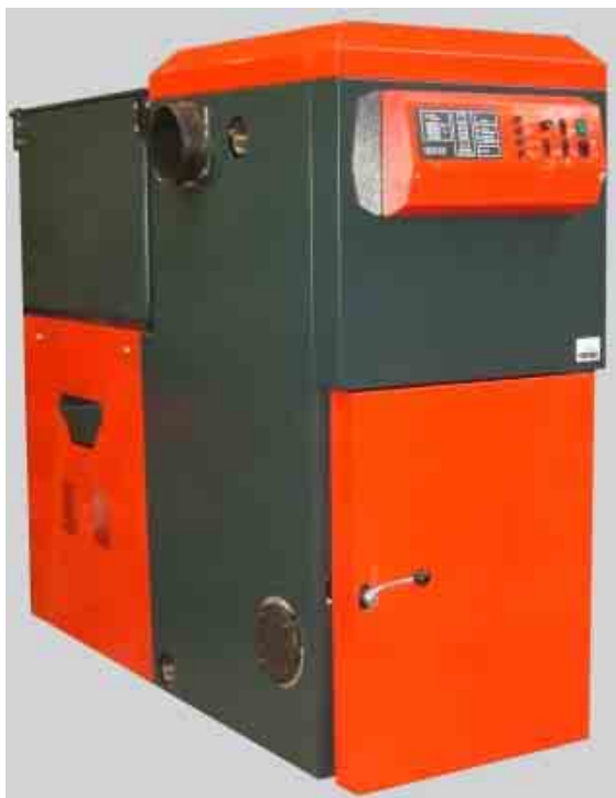
Kotel VERNER A50