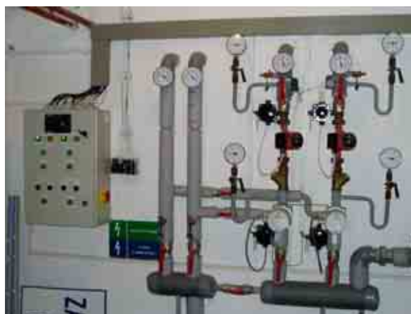
Ovládání kotlů a rozvody topné vody