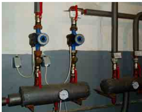
Rozdělovač topné a sběrač vratné vody

TV pro potřeby restaurace je ohřívána ve vlastním plynovém ohřivači, pro zázemí Kulturního domu je v prostoru pod jevištěm nainstalován elektrický ohřivač o objemu 100 l a příkonu 1,6 kW.