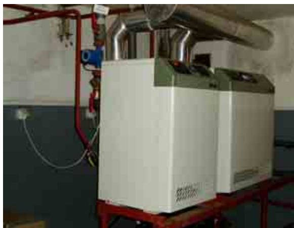
Kotle Viadrus v kotelně KD

Otopná soustava 2 je tvořena litinovým kotlem VIADRUS G 27 ECO GL 5 článků a opět dvěma topnými okruhy, restaurace s výkonem 15,4 kW a jídelna s 12 kW.