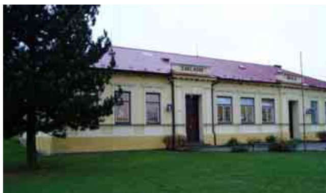
Budova Základní školy

Jednopodlažní nepodsklepená budova se sedlovou střechou je z roku 1889. Postavená je z plných cihel na průměrnou tloušťku stěny 750 mm. Jeden roh o menší tloušťce je přistavěný dodatečně z cihel CDm. Omítky jsou klasické, částečně opravené. Okna o různých velikostech jsou zdvojená. Půdorys má rozměry 31,65 x 15,95 m. Budovy ZŠ a za ní postavené MŠ jsou vzájemně propojeny spojovací chodbou.