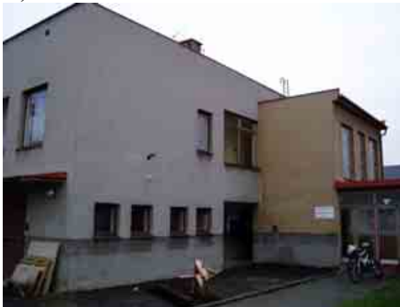
Průčelí budovy Mateřské školy

Budova Mateřské školy byla postavena roku 1975 na společném pozemku s historickou budovou, ve které sídlí Základní škola. Obvodové stěny jsou z cihel CDm o tloušťce 375 mm, omítky vnitřní jsou vápenocementové, vnější tvoří škrábaný Břizolit. Okna jsou dřevěná zdvojená, dveře jsou dřevěné prosklené. Objekt má plochou střechu. Rozměry půdorysu budovy jsou 28,35 x 13,05 m.