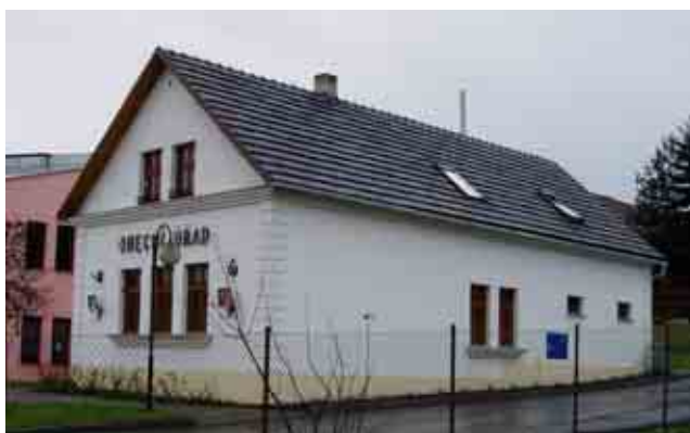
Budova obecního úřadu

Budova obecního úřadu je nepodsklepený, původně jednopodlažní dům s půdou pod sedlovou střechou, postavený někdy kolem poloviny 19. století. Při nedávné rekonstrukci byl přestavěn na dvoupodlažní, ve kterém je nad přízemním prostorem Obecního úřadu z původní půdy přistavěn v prvním patře byt 3 + 1.