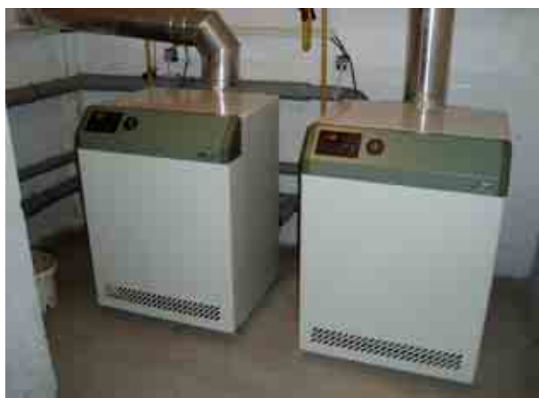
Kotle Viadrus v kotelně školky

Topný systém je rozdělen do dvou větví, jedna vytápí budovu MŠ a jedna je použita pro ZŠ. Regulace je ekvitermní, s jedním venkovním čidlem a regulačním zařízením LANDIS-GYR. Kotelna vyžaduje pouze občasný dohled.