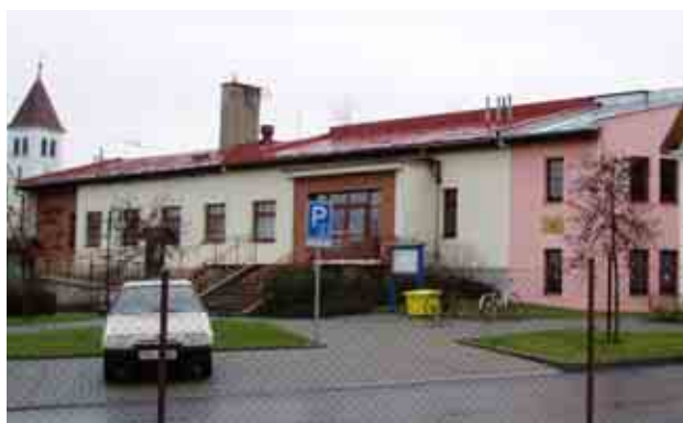
Budova kulturního domu, v levé části je pohostinství

Hlavní část Kulturního domu (s bílou omítkou) byla postavena v roce 1974 a je v ní na levé straně provozovna pohostinství s veškerým zázemím, na pravé straně pak sál, předsálí, zádveří se šatnou a sociálním zařízením. Obvodové zdi jsou z plných cihel o tloušťce 450 mm s klasickými omítkami. V zadní stěně je ve stěně sálu pět okenních otvorů, vyplněných luxfery ve dvou vrstvách se vzduchovou mezerou mezi nimi. Ostatní okna jsou eurookna s izolačním dvojsklem, instalovaná roku 2000. V suterénu pod pohostinstvím je kotelna, přístupná dveřmi z levé strany objektu.