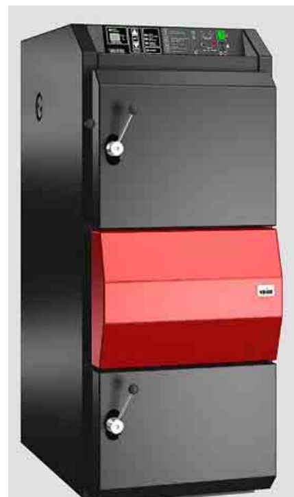
Kotel VERNER V45